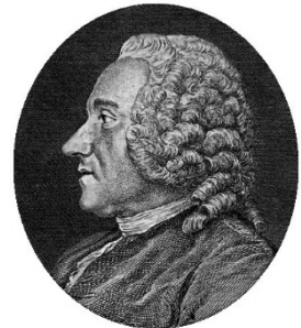
Louis René de Caradeuc de La Chalotais

Je vous remercie de proscrire l'étude chez les laboureurs. Moi qui cultive la terre, je vous présente requête