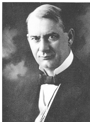
C. T. Russell et J. F. Rutherford.