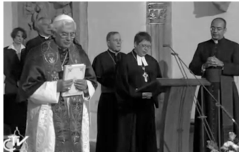
Une « évêquesse » entonne le Pater devant le pape lors d'une cérémonie œcuménique

de manière à ce que soient maintenues au sein de l'Église catholique les traditions liturgiques, spirituelles et pastorales de la Communion anglicane, comme un don précieux qui nourrit la foi des membres de l'ordinariat et comme un trésor à partager 3 .