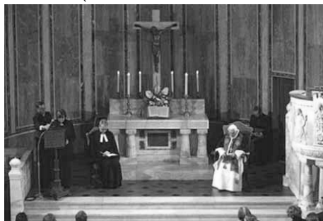
Au temple luthérien de Rome

— Visite du pape au temple luthérien de Rome. Le pape Benoît XVI s'est rendu au temple luthérien de Rome le dimanche 14 mars 2010. Jean-Paul II était venu au même endroit le 11 décembre 1983 (à l'occasion du 500 e anniversaire de la naissance de Luther) et il avait été le premier pape à se rendre dans un temple protestant. Benoît XVI est venu commémorer le 10 e anniversaire de la Déclaration conjointe sur la doctrine de la justification 3 signée par les représentants de l'Église catholique et ceux de la Fédération luthérienne mondiale, le 31 octobre 1999, à Augsbourg.