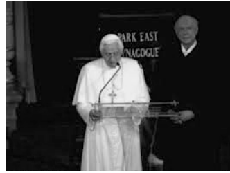
A la synagogue de New-York

J'en suis venu à penser que le judaïsme (qui ne commence, stricto sensu , qu'à la fin de la constitution d'un canon des Écritures, soit au 1 er siècle après Jésus-Christ) et la foi chrétienne exposée dans le nouveau Testament sont deux modes différents d'appropriation des textes sacrés d'Israël, tous deux ultimement déterminés par la façon d'appréhender le personnage de Jésus de Nazareth. L'Écriture que nous nommons aujourd'hui ancien Testament est en soi ouverte sur ces deux voies. Et nous n'avons en réalité commencé à comprendre qu'après