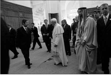
A la mosquée d'Amman

autels pour avoir dit à des musulmans qui venaient le voir : « Quiconque n'embrasse pas la foi chrétienne catholique est damné comme votre faux prophète Mahomet. »