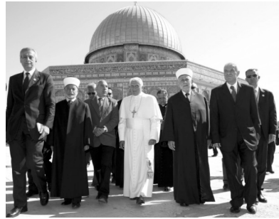
A la mosquée du Dôme

Chrétiens et musulmans, en suivant leurs religions respectives, insistent sur la vérité du caractère sacré et de la dignité de la personne. C'est la base de notre respect et de notre estime mutuels, c'est la base de notre collaboration au service de la paix entre les nations et les peuples , le souhait le plus cher de tous les