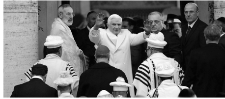
A la synagogue de Rome

Il a affirmé que « les juifs et les chrétiens sont appelés à annoncer et à témoigner du Royaume du Très-Haut qui vient » et que « les chrétiens et les juifs [...] prient le même Seigneur ».