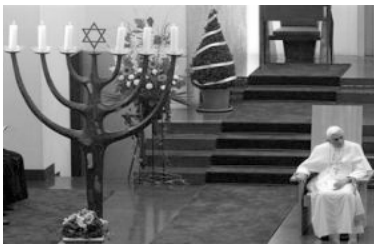
A la synagogue de Cologne

— Le pape a visité la synagogue de Cologne le 19 août 2005, peu de temps après son élection. Cette visite n'était pas prévue par Jean-Paul II dans le programme initial et a été ajoutée à la demande de Benoît XVI.