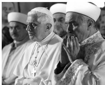
A la Mosquée bleue

— La Mosquée bleue de Constantinople le 30 novembre 2006. A l'invitation de son hôte musulman Mustafa Cagrici (mufti d'Istanbul), il s'y recueillit quelques instants, les mains croisées sous la poitrine, tourné dans la direction de la Mecque . Il avait auparavant enlevé ses chaussures et enfilé des babouches blanches pour y pénétrer. Les journalistes turcs ont reconnu dans son attitude la « posture de la tranquillité » (une des attitudes de la prière musulmane). Nous sommes loin de l'attitude de saint Pierre Mavimène, fêté le 21 février, placé sur les