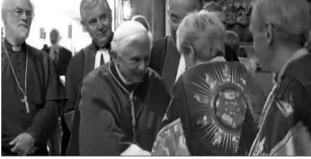
Le pape salue une « femme-prêtre » en chape, le 17 septembre 2010 à Westminster

La communication active matérielle et publique est, en soi, prohibée par la loi ecclésiastique et par la loi naturelle, sous peine de péché grave, et cela pour plusieurs motifs : péril de perversion dans la foi, scandale des fidèles, apparence d'approbation d'une religion fausse ou de négation de la vraie religion 1 .