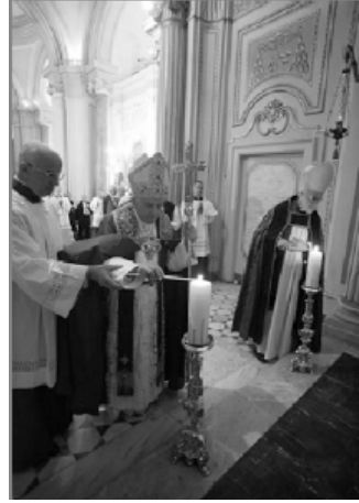
Le 10 mars 2012, le pape et « Sa Grâce » l'« archevêque » de Canterbury célèbrent les vêpres

« La fin d'un pontificat », dans la rubrique « Documents » de ce numéro, montre que la même orientation a continué. Nous ne pouvons que répéter, après Mgr Lefebvre : « C'est ici votre heure et la puissance des ténèbres » (Lc 22, 52-53).